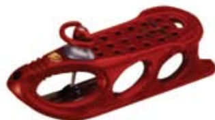
Санки Snow Shuttle de Luxe