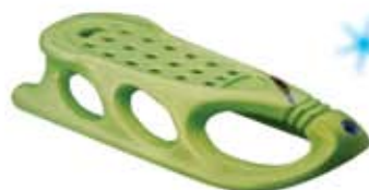
Санки Snow Shuttle