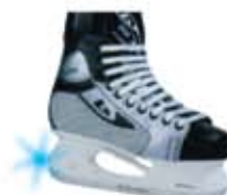
коньки Enfergy 312