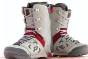
ботинки для сноуборда Deuse