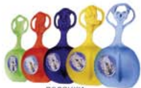
ледянки Snow Glider