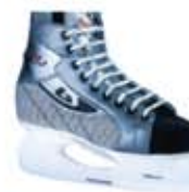
коньки Ergonomic 222