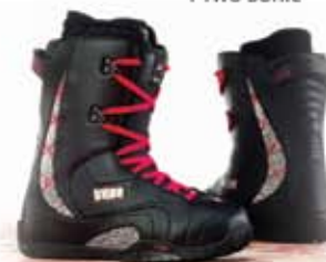
ботинки для сноуборда Onix